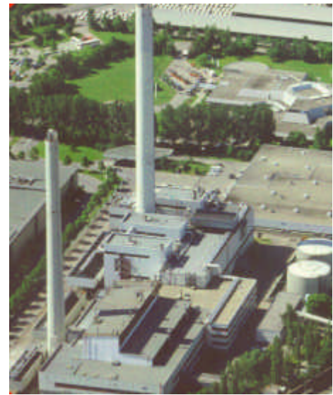
Heizkraftwerk im Werk Sindelfingen

Das mit umweltfreundlichem Erdgas bzw. leichtem Heizöl in Kraft-Wärme-Kopplung betriebene HKW nimmt somit eine zentrale Stellung in der Versorgung der Produktionsstätte ein. Zur Gewährleistung der Versorgungssicherheit stehen 4 Hochdruck-Dampfkessel (115 bar), 3 Mitteldruck-Dampfkessel (24 bar) sowie 5 Turbinen zur Verfügung. Damit wurde 1997 eine Verfügbarkeit des Heizkraftwerkes von über 99.9 % erreicht. Die Dampf- und Wärmeversorgung des Werkes erfolgt über zwei Dampfnetze (12/24 bar) und vier Heißwassernetze.